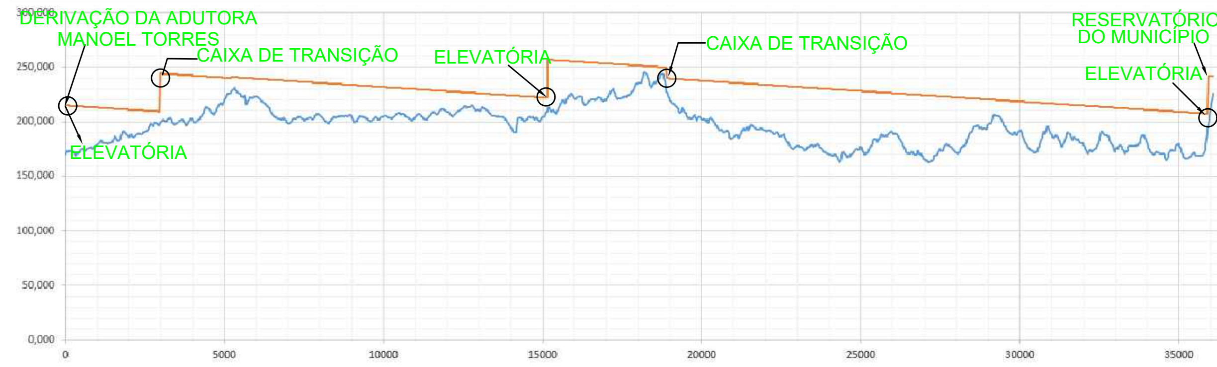
TUBULAÇÃO LINHA DE CARGA EFETIVA OU PIEZOMÉTRICA